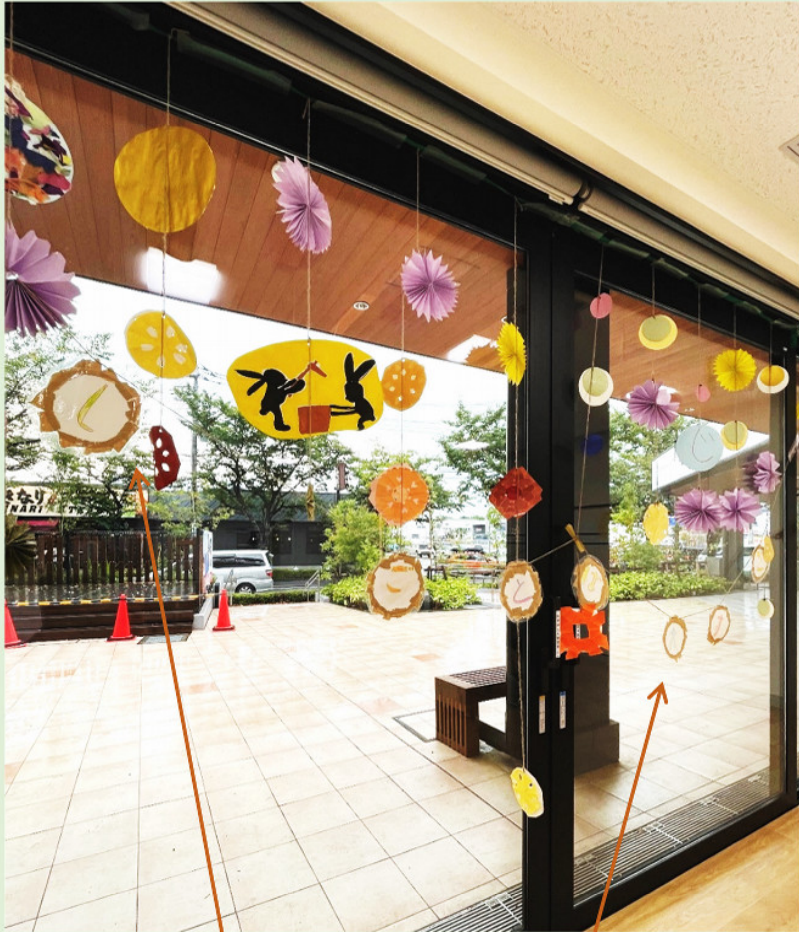
廃材段ボールを使い、作業所名をおしゃれガーランドに。