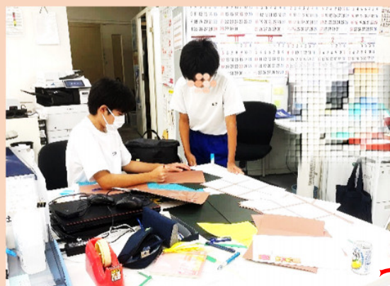
装飾設置 ▶ 受付 右側壁面