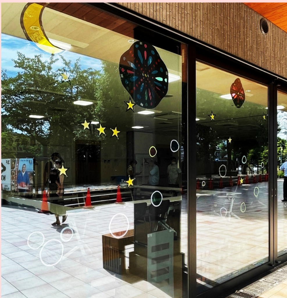
「花火」「月」「星」は室外から見ても成り立つよう両方面からの制作。