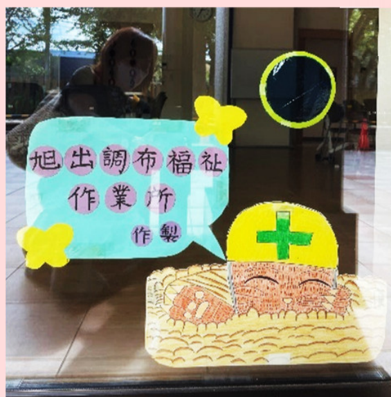
制作：旭出調布福祉作業所